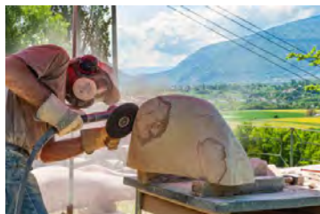
Atelier (Avusy, GE, Suisse)