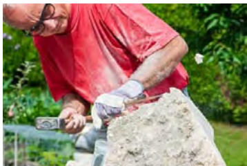
Carrière de Crozet, (Jura, France)

L'exposition comprend une sélection de photographies de Laurent Barlier ( laurentbarlier.ch ), documentant le travail de l'artiste à son atelier.