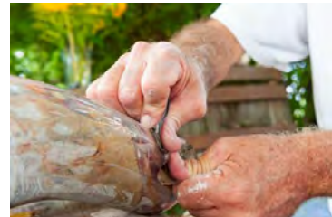
Atelier (Avusy, GE, Suisse)