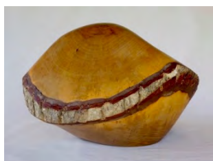
No 356, Noyer (Genève, Suisse) 42x42xh29cm. 2007