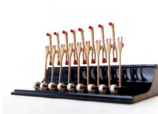
No 656, Piano en pièces 40,5x20xh20cm. 2018